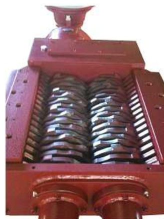
Version hydraulique possible