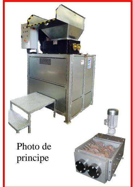
Photo de principe