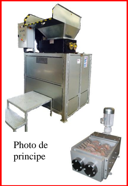
Photo de principe